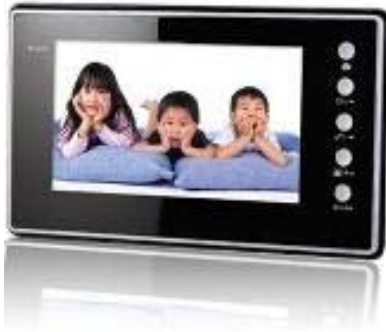
Gate View indoor Monitor