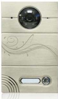
Gate View Outdoor Monitor