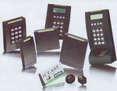
เครื่องอ่านบัตร (Reader)

เครื่องอ่านบัตรความถี่ที่ 13.56 เมกกะเฮิร์ซ มีไฟแถบสีบอกสถานะการทำงานที่ชัดเจน ได้รับมาตรฐานผลิตภัณฑ์จากอเมริกา มีให้เลือกหลากหลายรูปแบบ ตามความต้องการ ดังนี้